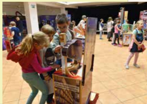
Erzsébetváros 2017. május 25.

Az interaktív utazó kiállítás szervezőinek célja, hogy az általuk fejlesztett egyedi eszközökkel bemutassák, és a gyermekek számára könnyen megérthetővé tegyék az emberi test működését. A gyerekek számára az egyik legizgalmasabb installáció a szívünk működését és dobogását bemutató eszköz volt. A kicsik feladata az volt, hogy egy gumipumpát kézzel összenyomva „működtessék a szívet”, így megtapasztalhatták, milyen kemény dolga van e szervünknek a vérkeringés folyamatos fenntartásában. A kiállítás témái, az eszközök nevei is beszédesebbek voltak: szívpumpa, szív-pingpong, hormonrakéta, májraktár, emésztőpálya, idegsejt-ragyogás, izomszalag-emelő, robotkar-irányítás, immundobáló, villámló agy, immun várvívás, bűjőcska az erekben, táplálékválasztó, tüdőventilátor, csonttráktó, idegrendszer-autópálya. Az erzsébetvárosi diákok is megtekintették a tárlatot a K11 központban, és hasznos információkkal gazdagodtak például az elsősegélynyújtásról, megelőzésről, egészséges életmódról, a helyes táplálkozásról, a szűrő- és önvizsgálatok fontosságáról.